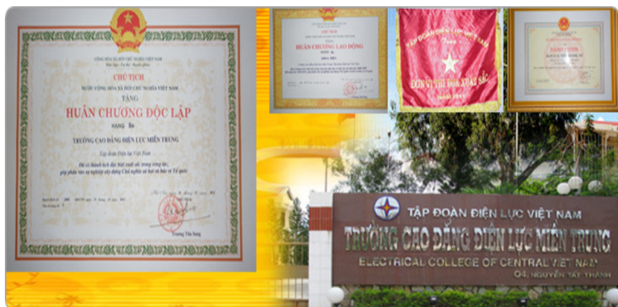
Các danh hiệu cao quý đạt được

Với những thành tích đạt được, trong 31 năm qua trường cao đẳng Điện lực miền Trung đã được nhà nước tặng thưởng nhiều huân chương lao động, 2 huân chương lao động hạng nhì, 4 huân chương lao động hạng 3, 2 nhà giáo ưu tú, 32 bằng khen của thủ tướng và hàng ngàn bằng khen, cờ thi đua xuất sắc của các bộ ngành và địa phương cho các tập thể cán bộ viên chức và học sinh- sinh viên. Đó là kết quả rất đáng tự hào, là sự cống hiến trí tuệ, mồ hôi, công sức của nhiều thế hệ cán bộ công nhân trường Cao đẳng Điện lực miền Trung.