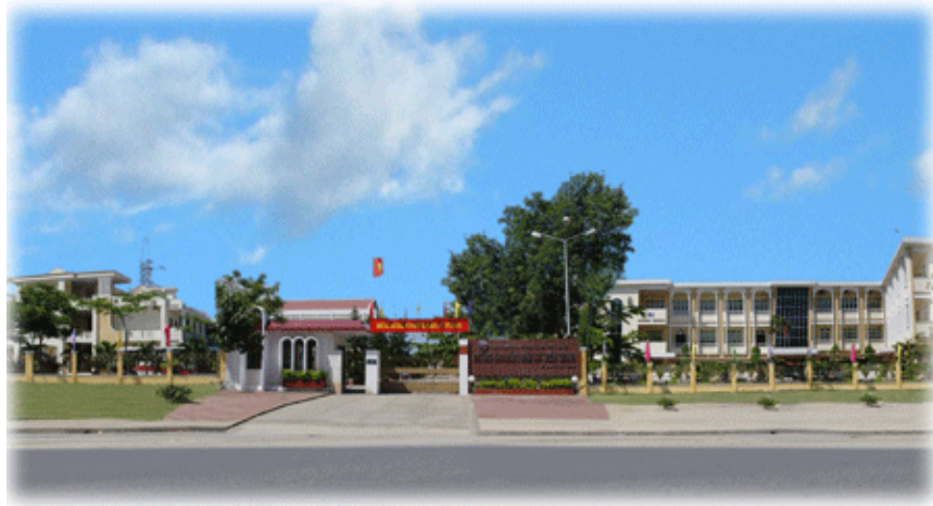
Trường Cao đẳng Điện lực miền Trung

Trong tất cả các thành tựu gặt hái được của Tập đoàn Điện lực Việt Nam, đã có sự đóng góp tích cực của tất cả các đơn vị thành viên mà trong đó có kể đến là sự đóng góp to lớn của Trường Cao đẳng Điện lực miền Trung.